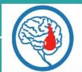
Accidente cerebrovascular al filtrarse la sangre en el cerebro