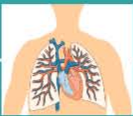
Ensanchamiento del corazón reduciendo su eficiencia