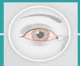
Lesiones de retina